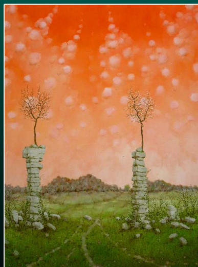
Všetky cesty vedú...